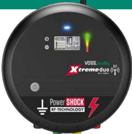
Smartes Weidezaungerät Xtreme duo RF

2. Komplette Fernsteuerung und Kontrolle von Zaunanlagen