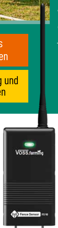
Fence Sensor FS 10