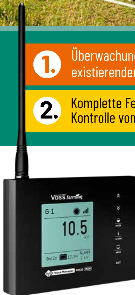
Fence Manager FM 20